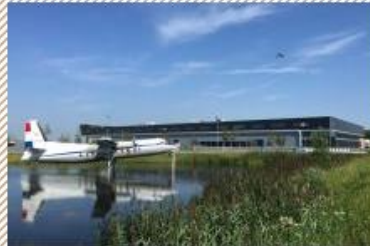
Bedrijfsgebouw Fokker 7