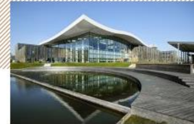
Transformatie kantoorgebouw Alliander Duiven